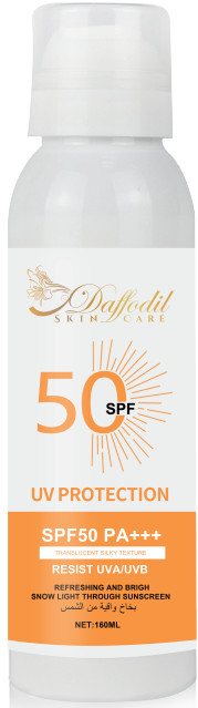
SUNSCREEN SPRAY بخاخ واقية من الشمس NET:160ML